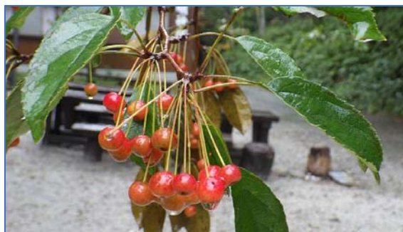
明神館前の色づいたコナシの実