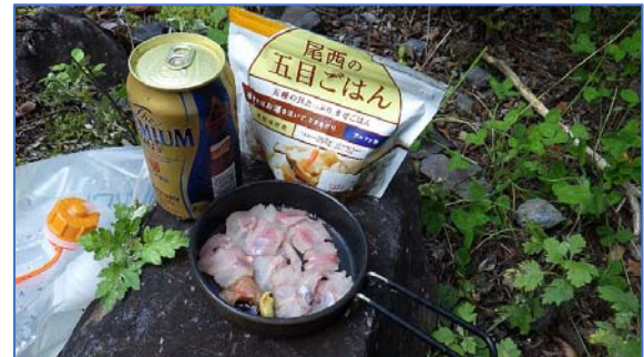
初日 夕食 おかずはイワナの刺身