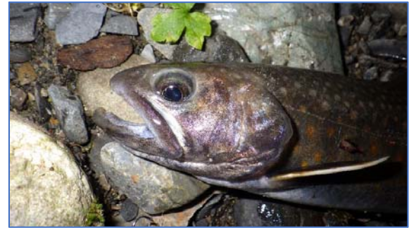
信州北アルプスの初イワナ(ニッコウイワナ)24.5 cm